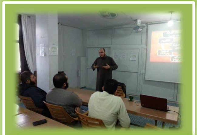
في المركز الثقافي التابع لهيئة الشام الإسلامية