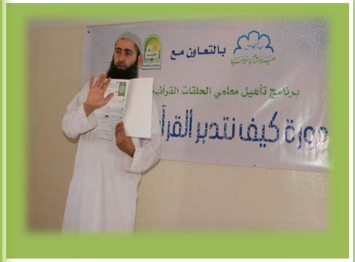
دورة التدبر في حربنوش