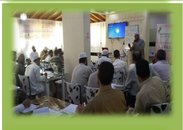
مع الدعاة في مشروع واعي