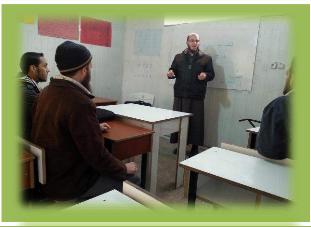
مع مدرسي الحلقة في منظمة بناء الإنسان