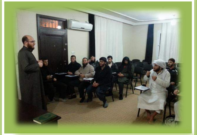
مع طلبة العلم في رابطة أبناء الشام التنموية