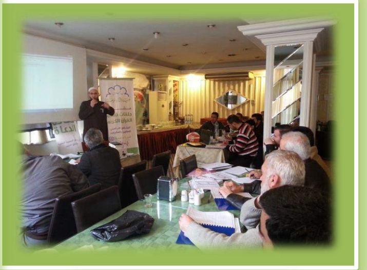
أثناء تقديم المستوى الأول