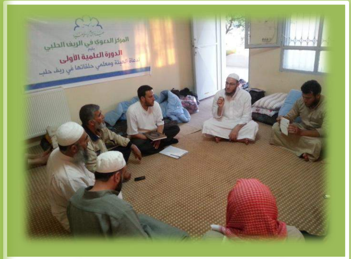
أثناء تقديم المستوى الأول