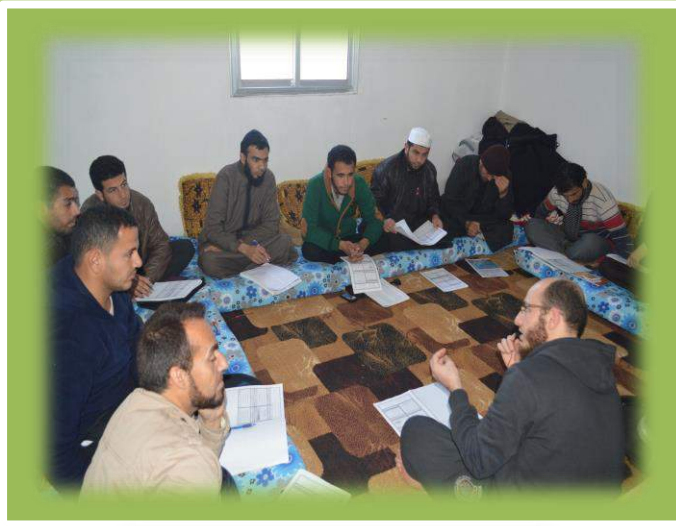
أثناء تقديم المستوى الثاني