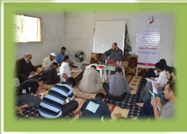
أثناء الامتحان النهائي