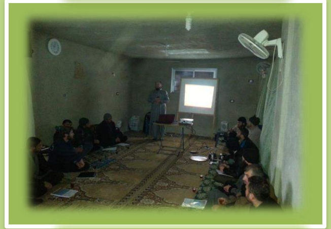
أثناء دورة فن الإشراف على الحلقات