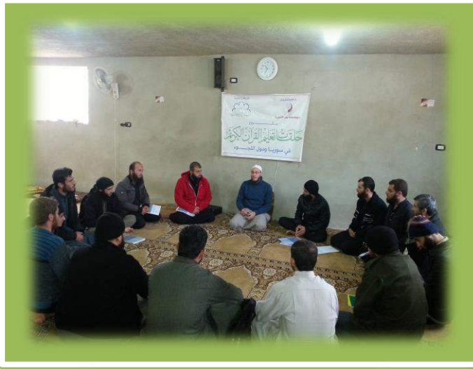
أثناء تقديم المستوى الثاني