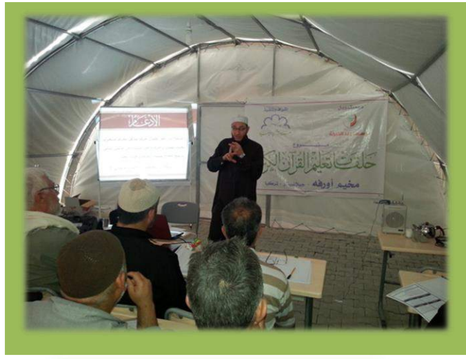
أثناء الشرح النظري في الدورة الثانية