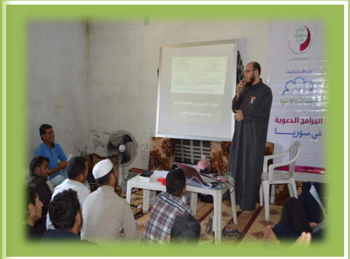
أثناء تقديم المستوى الأول