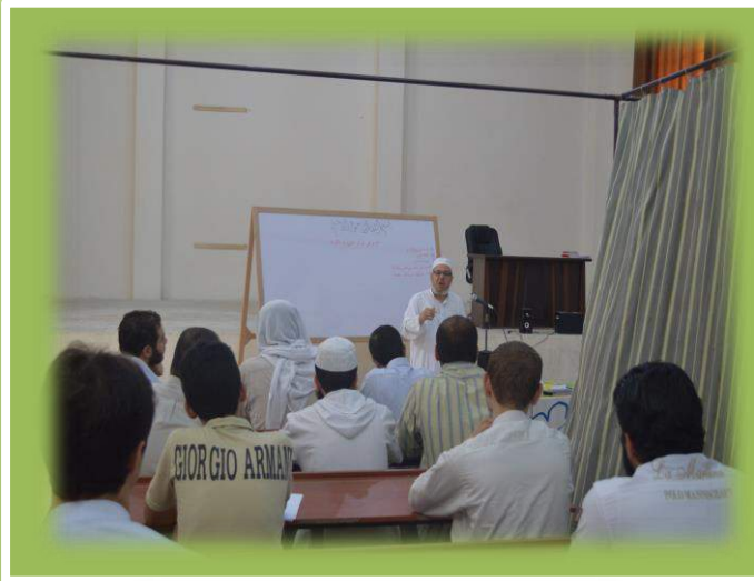
أثناء دورة تدبر القرآن الكريم