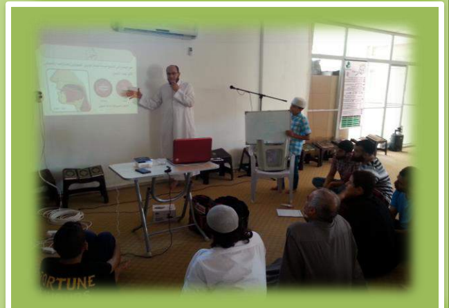
دورة في مركز ادع التابع لجمعية طيبة الإنسانية