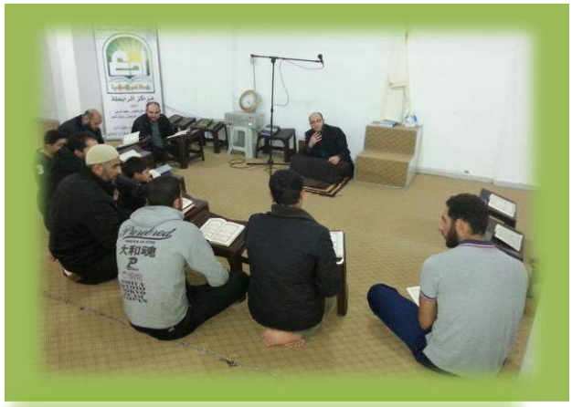
مع المتدربين في مركز ادع الإسلامي