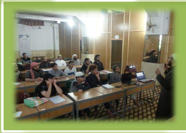
أثناء دورة خطة الحلقة