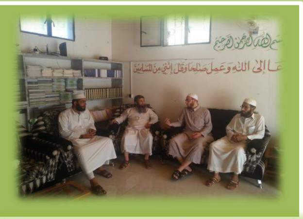
أثناء إحدى الزيارات لمشرفي الحلقات في ريف إدلب

تمّت بفضل الله زيارة غالب الحلقات في هيئة الشام الإسلامية، للاطلاع على سير العمل، وتقييم وتطوير أداء المدرسين وتقديم التوجيه لهم، والرفع لإدارة الحلقات في المكتب الدعوي بالتوصيات التي تساهم في تطوير العمل وتحسين النظم الداخلية لسير الحلقات وإدارتها وزيادة كفاءتها ومُخرجاتها. كما تمّت بالإضافة لهذا زيارة الكثير من الحلقات التابعة للمؤسسات الدعوية الأخرى للاطلاع على تجاربهم وبحث سبل التعاون المشترك والإفادة والاستفادة منها.