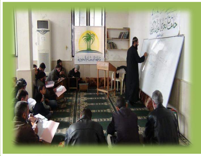
أثناء تقديم المستوى الثاني