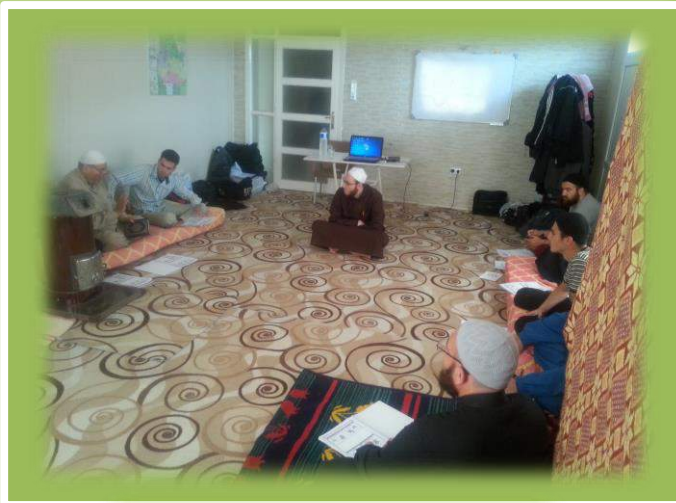
أثناء التطبيق العملي