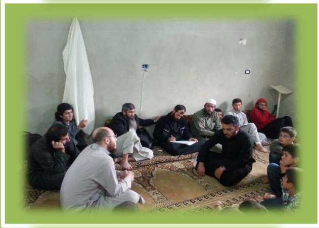
أثناء إجازة أحد المدرسين بالجزرية