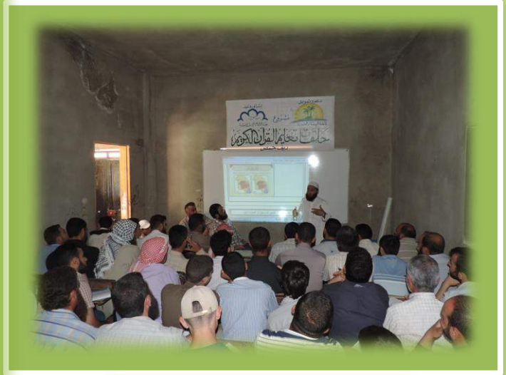
أثناء تقديم المستوى الأول