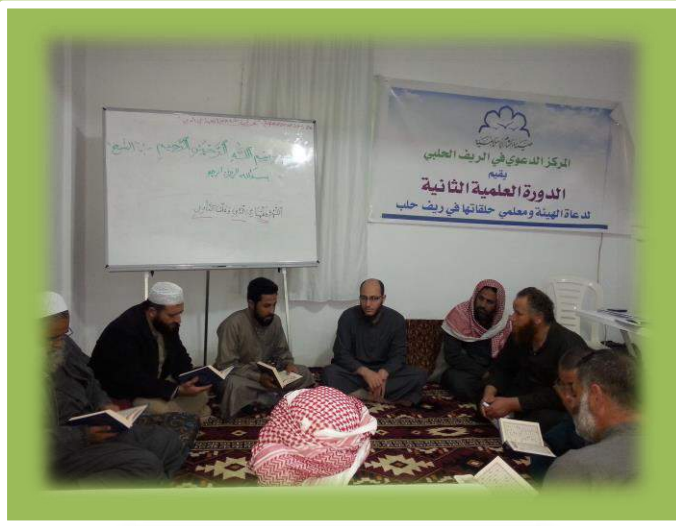
أثناء تقديم المستوى الثاني