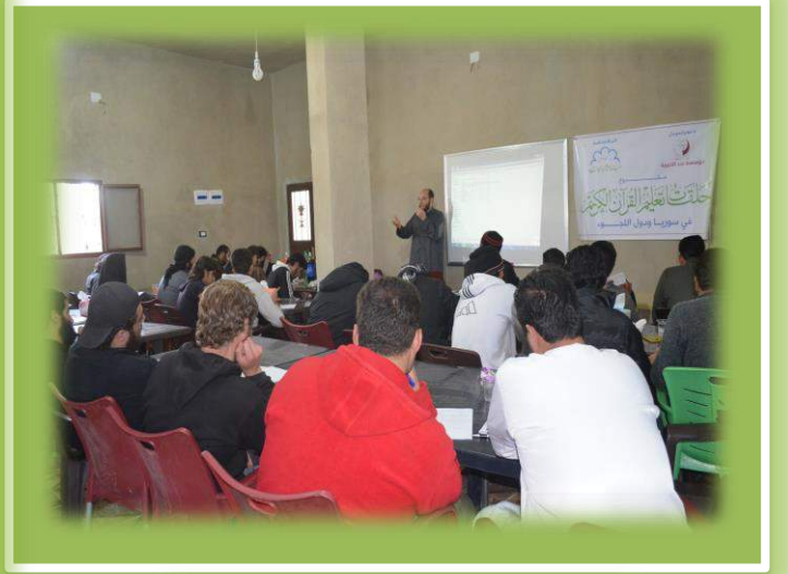
أثناء تقديم المستوى الأول