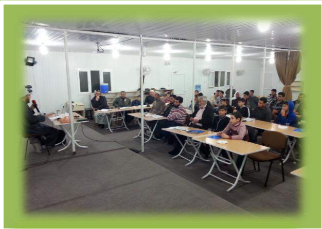
مع المتدربين في تجمع السلام السوري