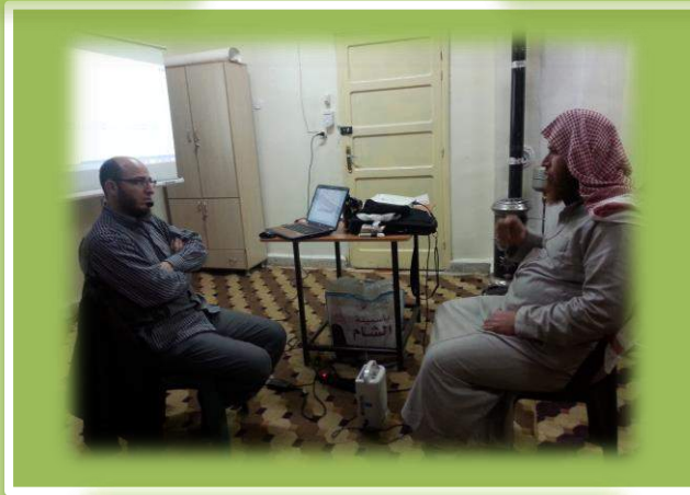
أثناء إجازة أحد المدرسين بالجزرية