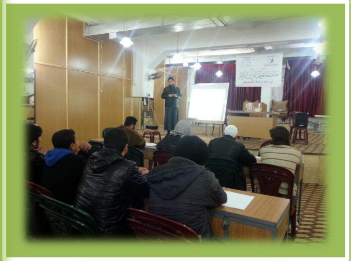
أثناء تقديم المستوى الأول