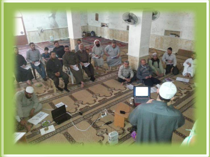
دورة معرة النعمان