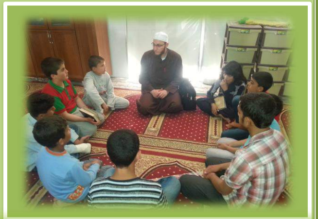
لقاء الطلبة النجباء في مخيم أورفت