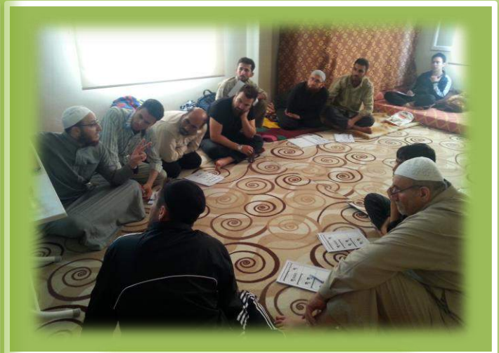
أثناء شرح المادة العلمية