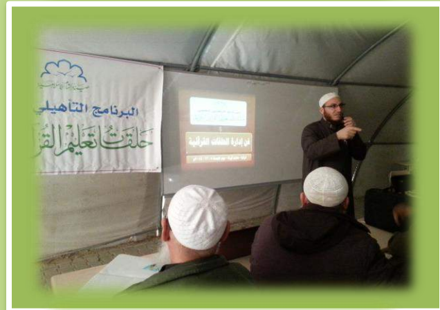
دورة فن إدارة الحلقة القرآنية