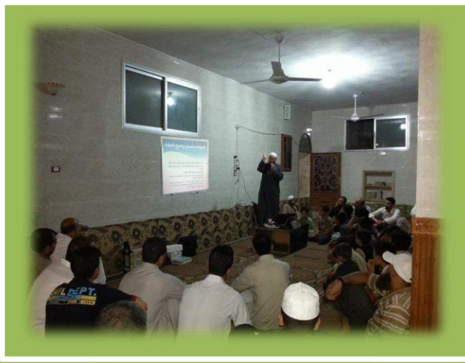
الدورة الأولى في قرية الغدفة