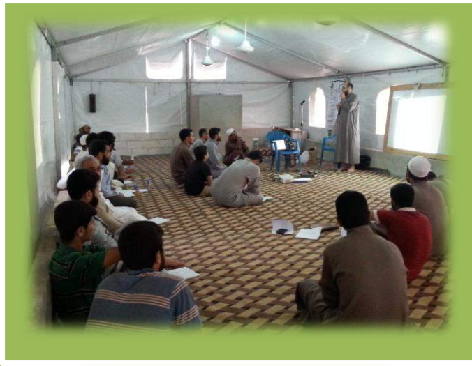
دورة الدعاة في مخيم أطمّة