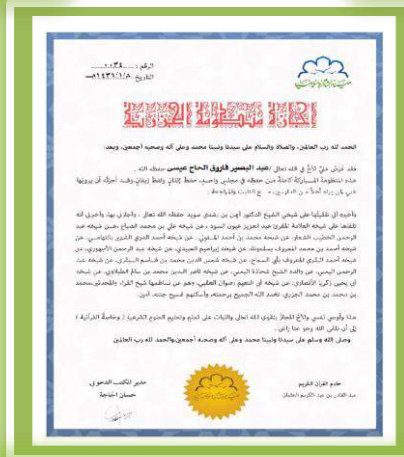
إجازة المشرف العلمي بمتن الجزية