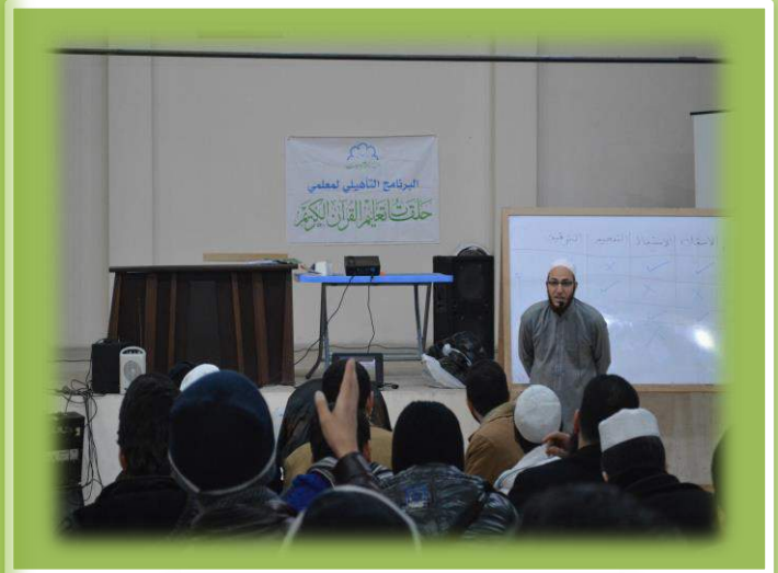
أثناء تقديم المستوى الأول