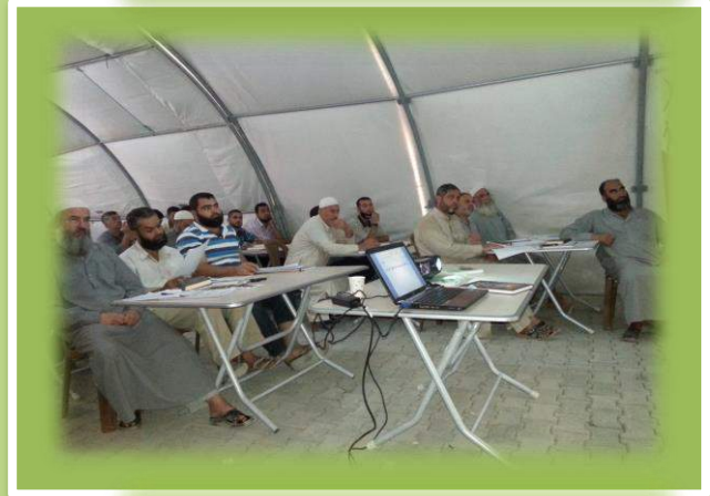
الحضور أثناء الدورة الثالثة