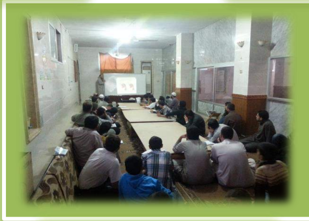
الدورة الثانية في قرية الغدفة