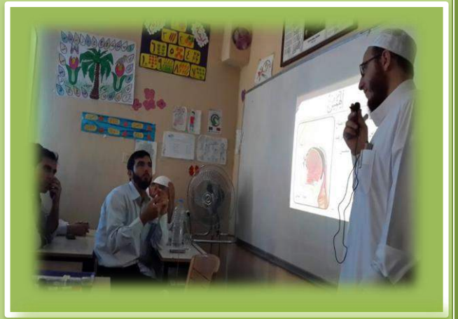
دورة مدرسة براعم الإيمان