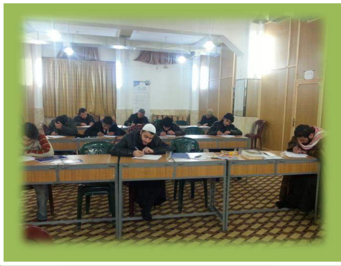
أثناء الامتحان النهائي