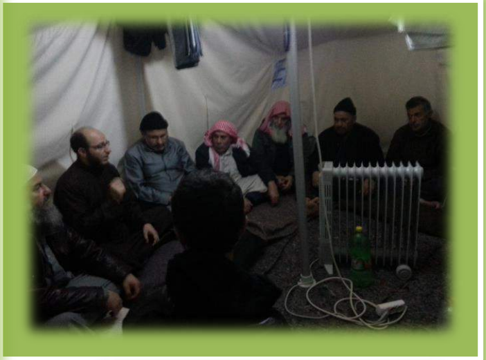
أثناء التطبيق العملي في الدورة الأولى